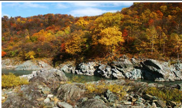
【神居古潭】位於石叢川從上川盆地流向石狩平原的邊界處，在愛努語中被稱為“Kamuy (神) Kotan”