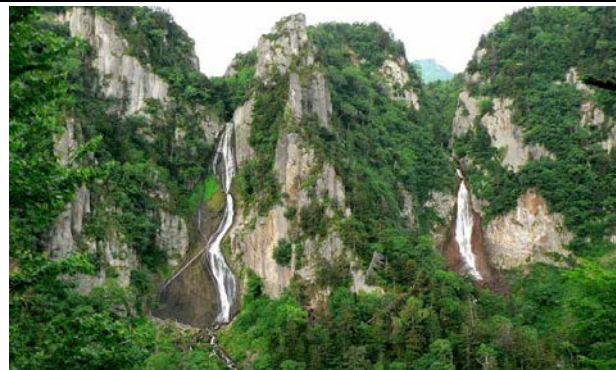
【流星、銀河瀑布】層雲峽的懸崖絕壁稱為「柱狀節理」，綿延不絕長達 24 公里。在由石狩川深深