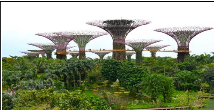
海濱灣花園+超級樹

【新山】是馬來西亞柔佛州的首府及歐亞大陸最南端的城市。新山市位於馬來西亞半島和歐亞大陸的最南端，因此亦享有「大馬南方門戶」、「南門城」等雅稱。